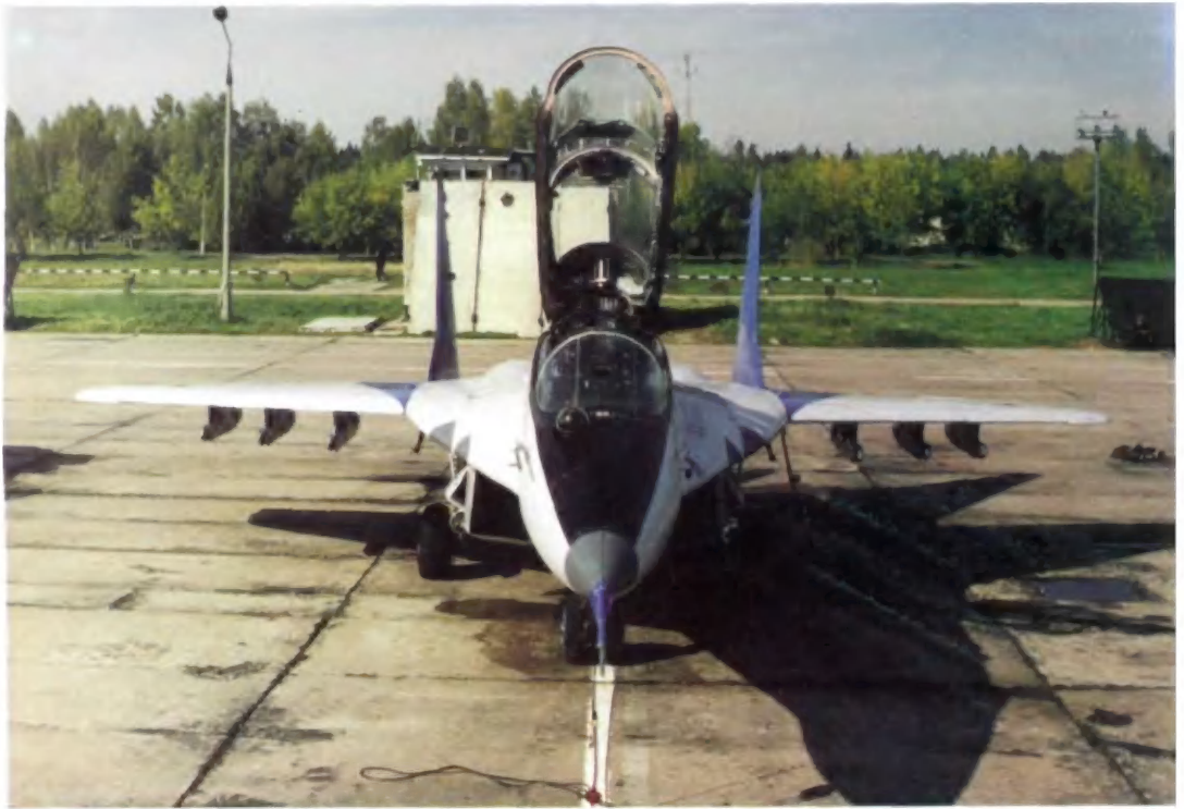
МиГ-29УБ (вверху) и А-50.